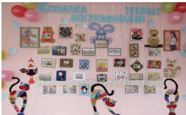
22 мая прозвенел последний звонок для 9 класса. 25 мая состоялась Выпускной.