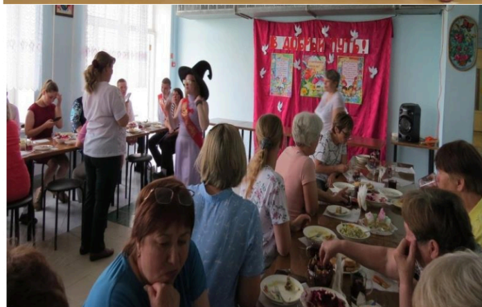
Все мероприятия, запланированные на май, проведены на 100%. Спасибо всем за работу.